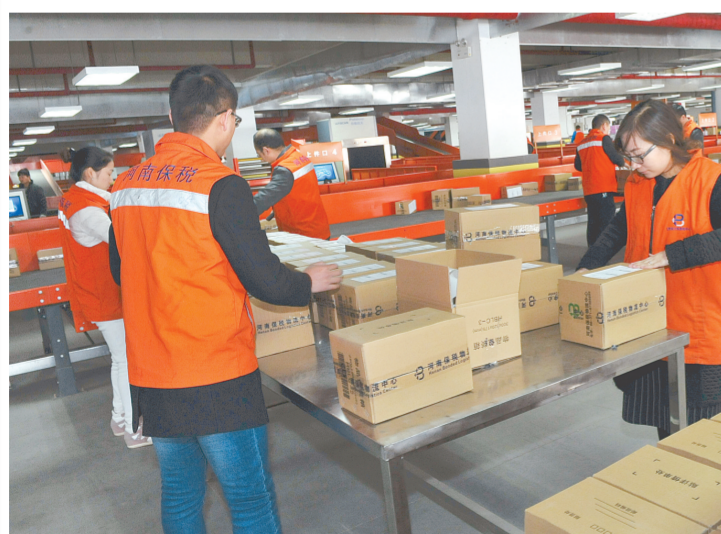
繁忙的河南保税物流中心一角