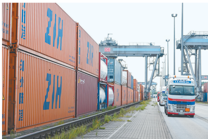
满载的集装箱随着郑欧班列来到德国汉堡

经历过“郑州商战”洗礼的郑州,在新时代下,正从内陆商贸城向“买全球 卖全球”的国际化商都嬗变。