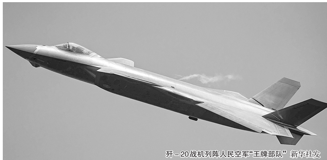
歼-20战机列阵人民空军“王牌部队”

新华社北京10月13日电(记者张汭汭李冀)空军新闻发言人申进科13日在北京召开的新闻发布会上介绍,庆祝人民空军成立70周年航空开放活动将于10月17日至21日在吉林长春举行。届时,空军多型武器装备将大规模、全系统亮相现场,歼-20、运-20等空军新型主力战机将同时展翅空军航空开放活动,展现空天力量、传播空天文化。