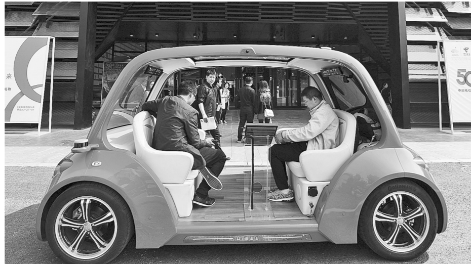
5G无人驾驶体验车