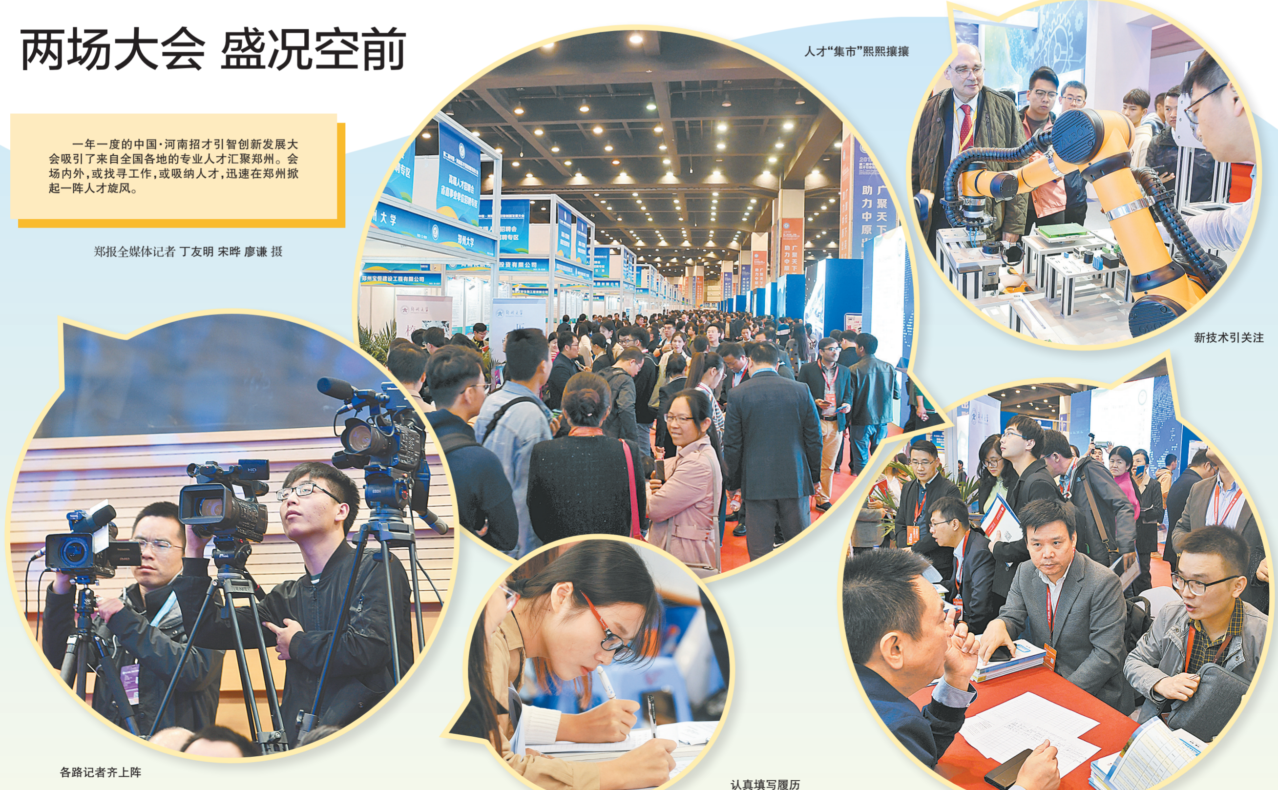
人才“集市”熙熙攘攘