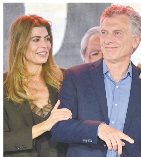
10月27日,在阿根廷布宜诺斯艾利斯,现总统毛里西奥·马克里在竞选失败后与妻子阿瓦达向人们致意。

阿根廷官方计票结果27日显示,中左翼政党联盟候选人阿尔韦托·费尔南德斯在首轮总统选举中击败现任总统毛里西奥·马克里,当选新一任总统。