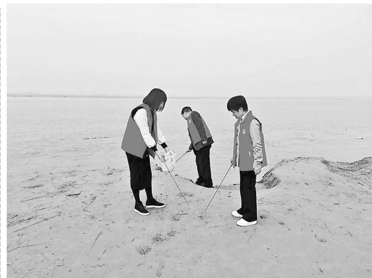
日前,惠济区科协组织志愿者来到黄河湿地公园,开展“不忘初心跟党走,牢记使命见行动”捡拾白色垃圾、烟头等志愿服务主题党日活动。本报记者 梁月琳 摄

路,提升眼界。提供了一个协同融合的舞舞台,企业家借助“走进名企”这个平台,经常到优秀企业看一看、比一比,有助于找到促进自身健康快速发展的道路。打造了一个合作共赢的联盟。园区企业之间,部分企业有上下游关系的,通过“走进名企”将相关企业聚集到一起,促进其相互合作。营造了一个良好的创新氛围。“走进名企”系列活动致力于在企业家中营造良好创新氛围,传播政府扶持创新相关政策,集聚各类创新资源,让企业家的创新激情竞相迸发。“走进名企”系列活动截至目前,已经举办了3期。