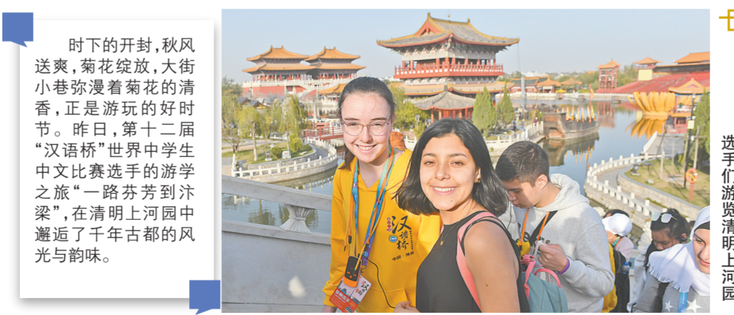
选手们游览清明上河园