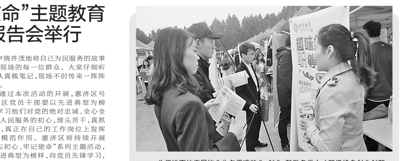
为促进高校应届毕业生多渠道就业、创业,鼓励各类人才积极投身创新创业事业,郑州人力资源和社会保障局、惠济区人力资源和社会保障局、郑州财经学院联合举办了“郑州财经学院2020届毕业生双选会”。480余家用人单位提供了16000多个就业岗位,吸引了众多毕业生。

本报讯(记者 栾月琳 通讯员 李经纬 孟刘奇)为认真贯彻落实“不忘初心、牢记使命”主题教育活动要求,昨日下午,惠济区在新城街道第一会议室举行“不忘初心、牢记使命”主题教育先进典型宣讲报告会,全区委局下沉干部、新城街道机关及辖区村(社区)党员干部150余人现场聆听了报告会。