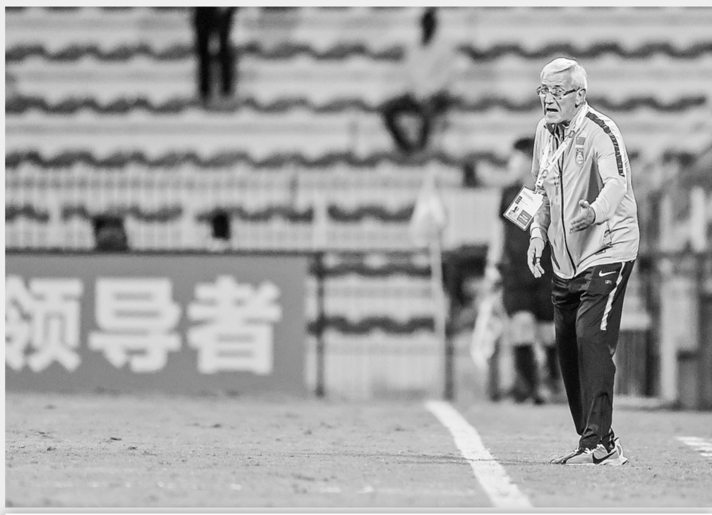
11月14日,中国队主教练里皮在比赛中指挥。

这是里皮第二次辞去中国男足主教练职务。在今年1月举行的亚洲杯比赛中,里皮在球队以0:3输给伊朗队之后也宣布辞职。