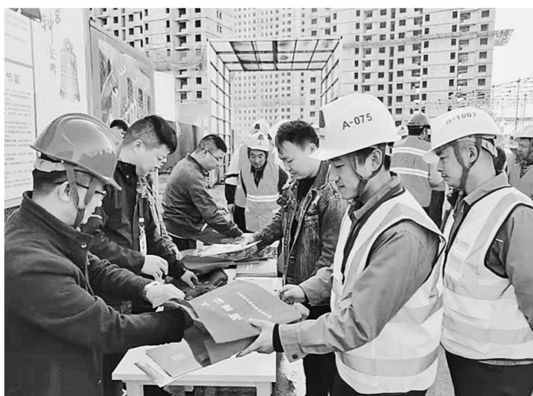
为进一步改善环境空气质量,提升建设项目施工单位大气污染防治意识,昨日,惠济区住建局在辖区各建筑工地开展秋冬季大气污染防治宣传进工地活动,向施工单位讲解建筑工地扬尘治理标准中“六个不准”“八个百分百”等相关法律法规。

金河社区书记说,在这里居民依法民主自治得到了更加充分的体现,最大限度地凝聚了人心。以党建引领小区发展,让居民感受到党组织的温暖,幸福感安全感不断增强。