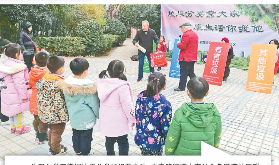
为深入学习掌握垃圾分类知识及方法,未来路街道办事处金色港湾社区联合垃圾分类机构开展“垃圾分类走进幼儿园”活动。图为工作人员带领孩子们参与垃圾分类趣味知识竞猜竞赛活动。

《郑州市城市生活垃圾分类管理办法》已正式施行,为扩大群众的知晓率,中原西路街道办事处、万达广场社区、傲蓝得环保联合举办垃圾分类宣传活动。活动中,将垃圾分类编成朗朗上口的“三句半”,引导居民进行垃圾分类。还设置了“垃圾分类转转转”游戏区,游戏转盘上标示着生活中经常产生的各种垃圾品种,参与居民转动转盘,根据指针指示,转动外盘对准正确分类,答对的当场获得奖品。