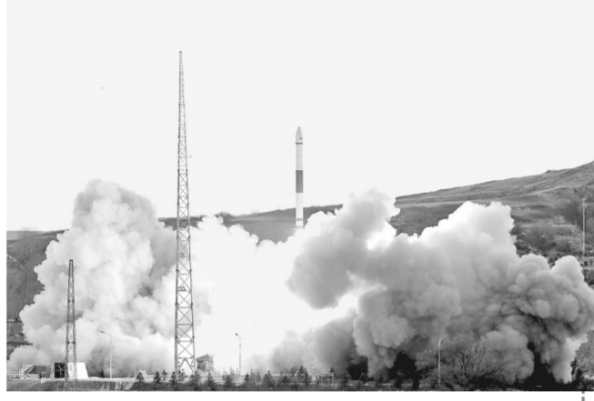
12月7日16时52分 我国在太原卫星发射中心用快舟一号甲运载火箭,采用“一箭六星”的方式,成功将和德二号A/B卫星、天仪16/17卫星、天启四号A/B卫星发射升空。