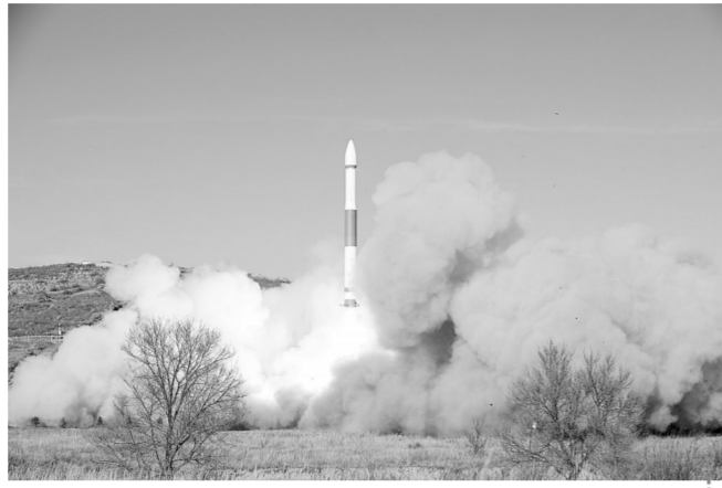
12月7日10时55分 我国在太原卫星发射中心用快舟一号甲运载火箭,成功将“吉林一号”高分02B卫星发射升空。卫星顺利进入预定轨道,任务获得圆满成功。

上个月的13日,我国曾分别在酒泉和太原两个航天发射场,在175分钟内连续放飞两枚不同型号的运载火箭。