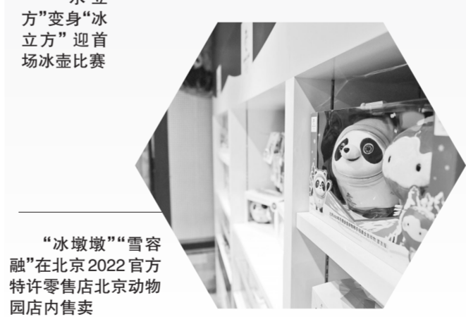
“冰墩墩”“雪容融”在北京2022官方特许零售店北京动物园内售卖