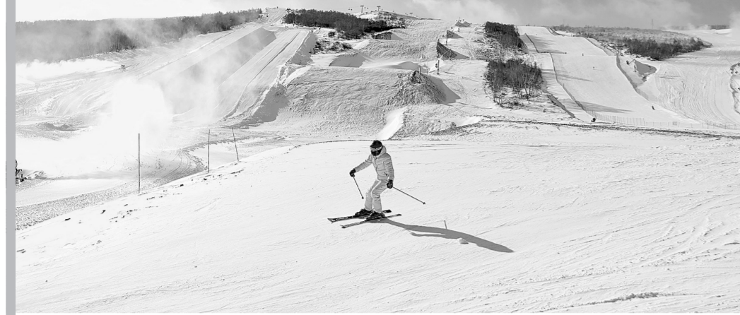
一名滑雪爱好者在张家口崇礼云顶滑雪公园滑雪