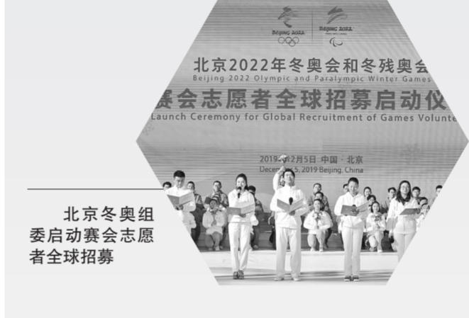
北京冬奥组委启动赛会志愿者全球招募