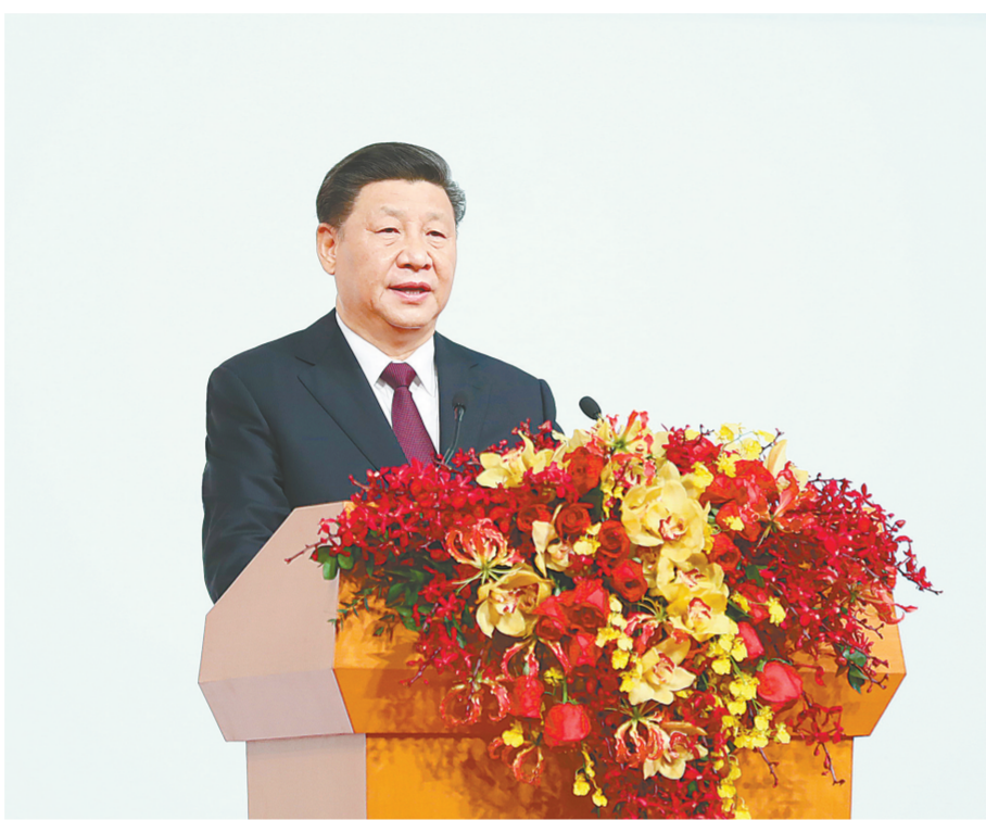
习近平出席庆祝澳门回归祖国20周年大会暨澳门特别行政区第五届政府就职典礼并发表重要讲话。