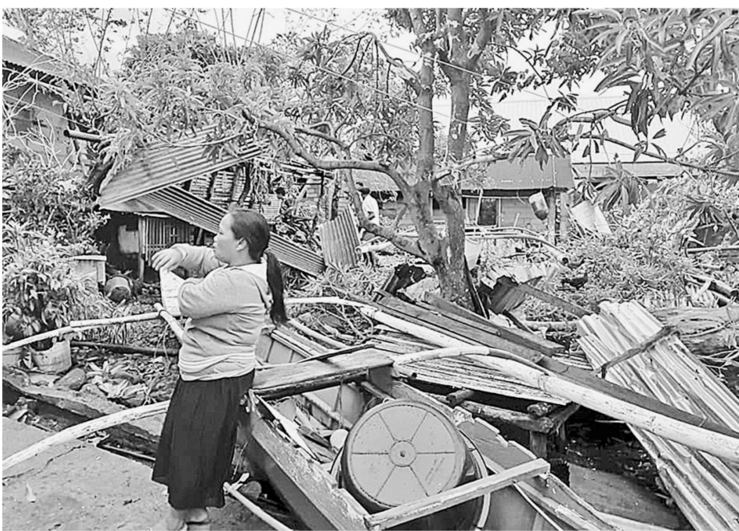
这张12月26日来自社交媒体的照片拍摄的是台风过后一片狼藉的菲律宾比利兰

据新华社马尼拉12月26日电(记者 郑昕 袁梦晨)菲律宾官方26日证实，24日在菲中部萨马岛登陆的台风“巴蓬”已造成9人死亡，数万众民众转移避难，当地交通受到较大影响。