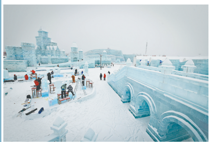
1月7日，参赛者在进行冰雕创作。当日，在哈尔滨冰雪大世界园区举行的第三十四届中国哈尔滨国际冰雕比赛进入第二天，参赛的冰雕作品已芳容初现。