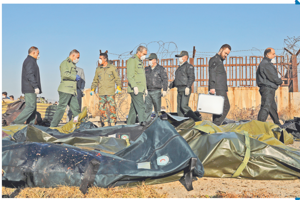
1月8日，在伊朗德黑兰霍梅尼国际机场附近，安全人员在客机坠毁事故现场工作。

乌克兰和伊朗先前说法是遇难者包括82名伊朗人和63名加拿大人。加方政府说，不少遇难者持有伊朗加拿大双重国籍。 新华社特稿