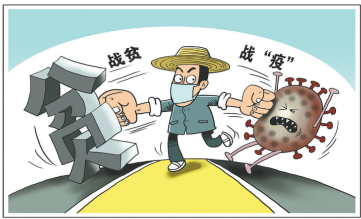
两手都要硬 新华社发 朱慧卿 作

通知要求,重点做好深度贫困地区就业帮扶。将“三区三州”等深度贫困地区、易地扶贫搬迁安置点所在地区以及挂牌督战的