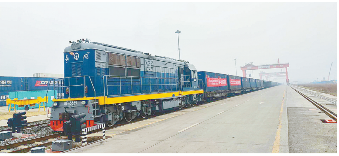
昨日,中铁联集郑州中心站春节后疫情防控期间首趟多联快车鸣笛开行。