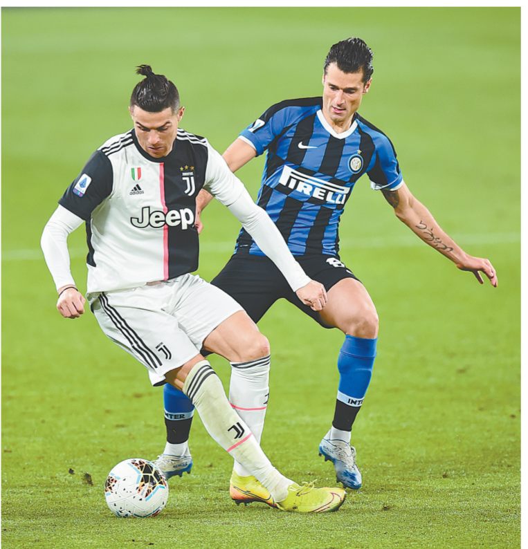
C罗(左)与国际米兰队球员坎德雷瓦拼抢

新华社罗马3月8日电 尤文图斯队8日在意甲联赛中主场2:0战胜国际米兰队, 在赢下意大利“国家德比”的同时, 队中当家球星克里斯蒂亚诺·罗纳尔多(C罗)也完成了自己职业生涯的第1000场比赛。