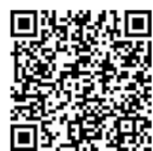
扫二维码看河南《新闻联播》视频

南、郑州人民的精气神,提高城市的影响力和美誉度。 徐立毅强调,新郑市要发挥文物古迹丰富、历史文化厚重的优势,充分发掘文化遗产,加快打造历史文化名城。要深化黄帝故里核心区规划研究,在保持拜祖广场整体格局基本稳定的前提下,进一步充实、提升、完善规划建设方案,处理好点与点、点与面、核心要素与配套功能之间的关系,深入研究建筑风貌、表达方式、艺术手段,更好地讲述黄帝故事、展示黄帝文化。要处理好核心区与周边区域的关系,深入挖掘郑韩故城、车马坑、古县衙等历史文化遗址,梳理好城市肌理,以有机更新充实周边区域内涵,做到风貌协调、肌理清晰,更好体现历史纵深感、连续性。历史文化项目要统筹考量、加快推进、同步展开,尽快出形象、有效果,更好地提升拜祖大典的层次和品质,更好地提升区域的文化品位和内涵。