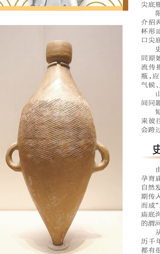
仰韶文化时期的“网红产品”——小口尖底瓶。