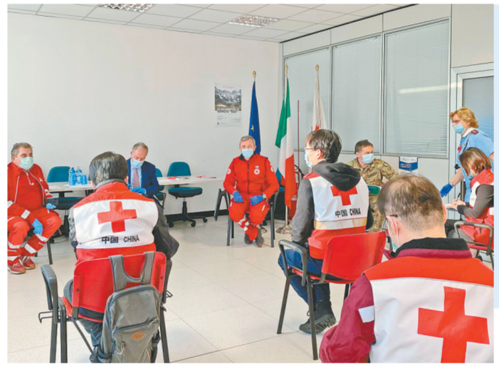
3月17日，在意大利帕多瓦，中国抗疫医疗专家组与当地医生、红十字会人员开会交流。 3月17日，中国抗疫医疗专家组从意大利首都罗马奔赴疫情严重的北部城市帕多瓦。

他说，面对当前疫情在全球蔓延的严峻形势，中方愿继续与各方加强抗疫国际合作，共同应对疫情全球大流行的挑战，推动构建人类命运共同体。