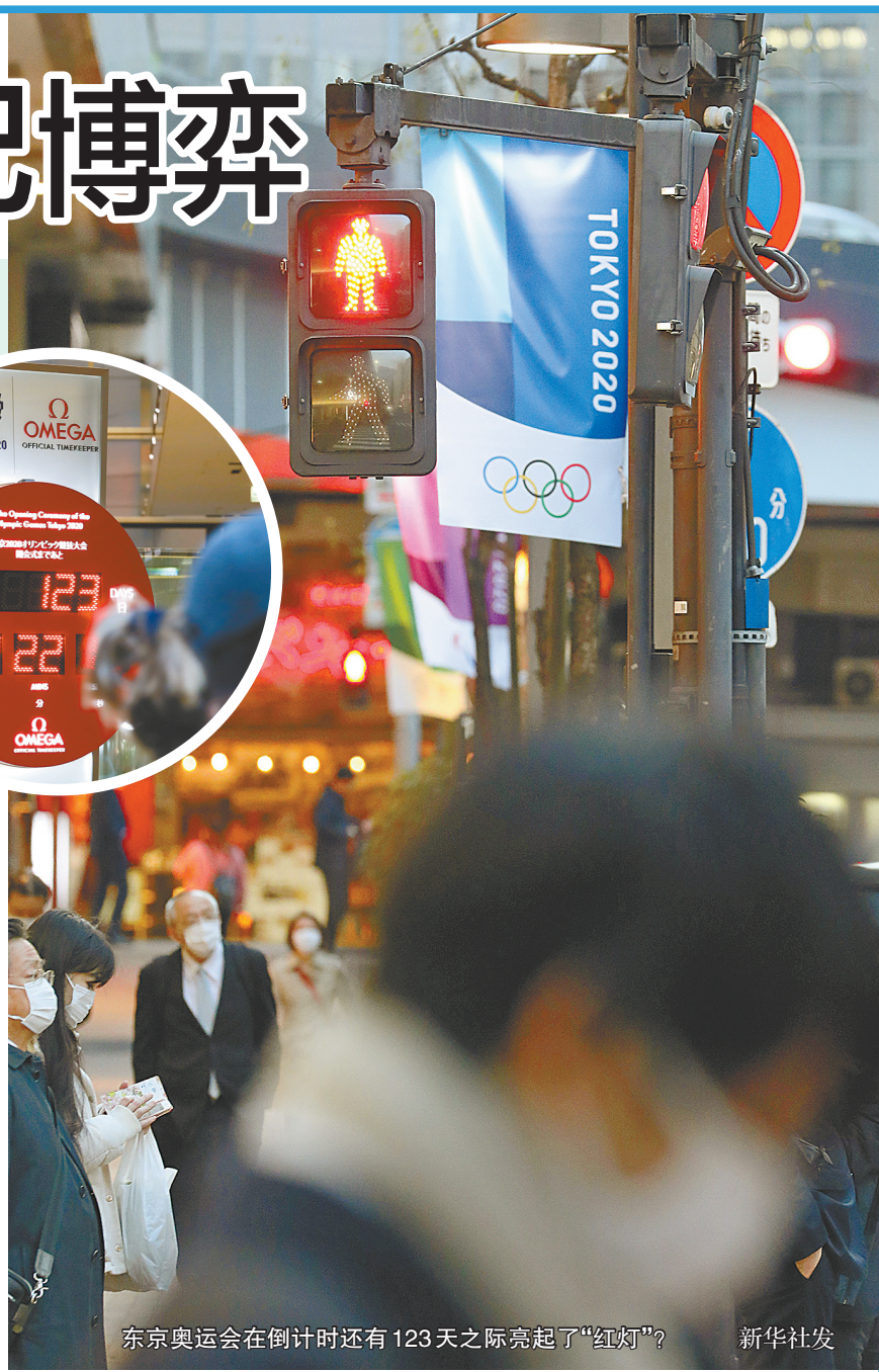
东京奥运会在倒计时还有123天之际亮起了“红灯”？

确保运动员的利益和奥林匹克运动的利益不受损害。国际奥委会表示在距离奥运开幕还剩下一个多月之际，做出最终决定还为时尚早。 而在过去的48小时，在媒体报道中，要求尽快推迟东京奥运会的声音越来越多。重压之下，国际奥委会执委会召开紧急电话会，首次官方承认考虑不同方案，并设定了四周的决定期限。 在致全球奥林匹克选手的公开信中，国际奥委会主席巴赫诚恳、详细地解释了当前的困境。他首先表示，取消东京奥运会不在议程之上，因为这将摧毁来自206个国家(地区)奥委会和难民代表团的11000名运动员的奥运梦，取消奥运会不能解决任何问题，不能帮助任何人。 与此同时，他说，如果今天宣布推迟，由于疫情的不确定性，也无法确定一个新日期。而且由于奥运会的极端复杂性，推迟奥运会也不像推迟其他体育赛事那么简单。“根据目前的信息来看，对东京奥运会的举办日期做出最终决定还为时尚早。”