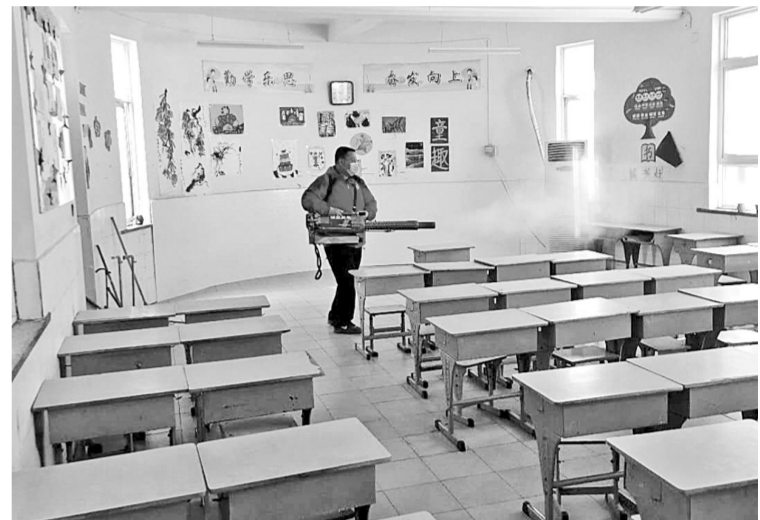
近日,共青团郑州市委、共青团二七区委组织郑州市小水清志愿服务中心、绿园家政服务中心的志愿者走进政通路小学,为二七区中小学捐献了500斤84消毒液等防疫物资并开展了全方位校园消杀工作。本次二七区中小学义务消杀工作将持续2~3天,涵盖19所中小学。

2020年荥阳市“春满中原”互联网+促消费、推上行、助脱贫活动是荥阳“最美荥阳·嗨乐荥阳”为主题的全民消费月活动的重要组成部分。为加快服务业振兴,刺激消费,在荥阳全民消费月期间,商超、餐饮、酒店、文旅等各行各业都将陆续开展各类让利活动。