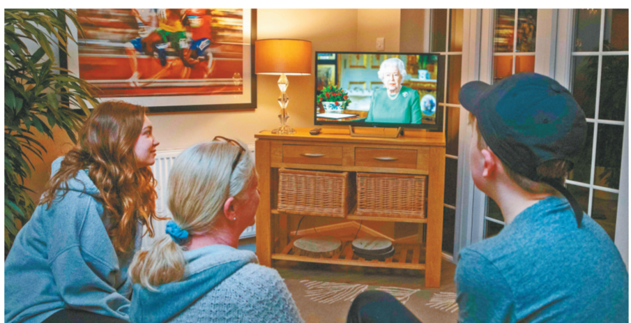
4月5日，在英国伦敦，人们在家观看电视播放的英国女王特别讲话。

英国首相府5日晚说，先前确诊感染新冠病毒的首相鲍里斯·约翰逊症状未见减轻，当晚进入一家医院接受检查。 首相府在声明中说，在医生的建议下，约翰逊当晚入院接受检查。声明强调，约翰逊并非因为病情紧急而入院，入院检查只是预防性措施，采取这一措施是因为约翰逊在确诊10天后依旧持续出现发热等症状。 声明说，约翰逊依旧“掌管”英国政府。路透社援引一名消息人士的话报道，英国外交大臣多米尼克·拉布6日将主持英国政府以应对疫情为主题的会议。 约翰逊现年55岁，去年7月接替特雷莎·梅出任英国首相。