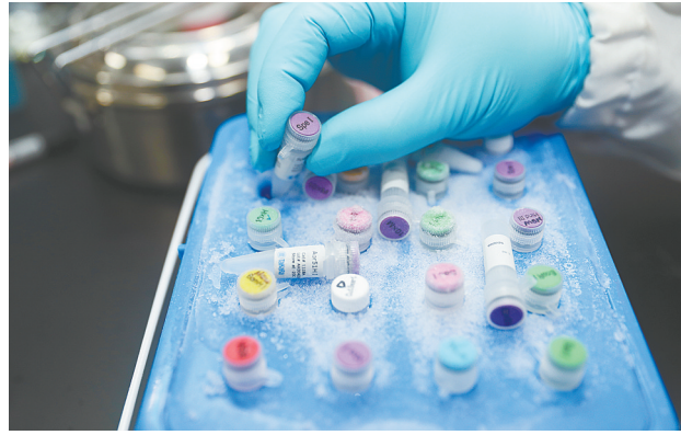
▲2月11日，世界卫生组织总干事谭德塞(右二)表示，新型冠状病毒疫苗有望在18个月内准备就绪。新华社发 ▲1月29日，在中国上海，工作人员在演示新型冠状病毒mRNA疫苗实验过程。新华社发