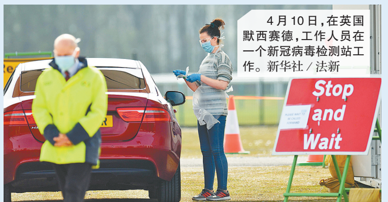
4月10日，在英国默西赛德，工作人员在一个新冠病毒检测站工作。

唐宁街首相府发言人詹姆斯·斯莱克10日说，约翰逊处于恢复初期，能“走一走，歇一歇，再走一走”。 斯莱克说，约翰逊已与医生交流，表达感谢；院方说，约翰逊9日晚从重症监护病房转回普通病房时向医生和护士挥手致谢，“精神非常好”。 约翰逊的父亲斯坦利·约翰逊告诉英国广播公司电台，约翰逊必须“充分休息”，需要一段时间才能回首相府办公。 约翰逊3月27日在社交媒体发布自己新冠病毒检测结果呈阳性的消息，之后在首相府楼上的住所自我隔离，以视频会议形式办公。由于发热、咳嗽等症状不退，这名55岁的英国领导人4月5日到