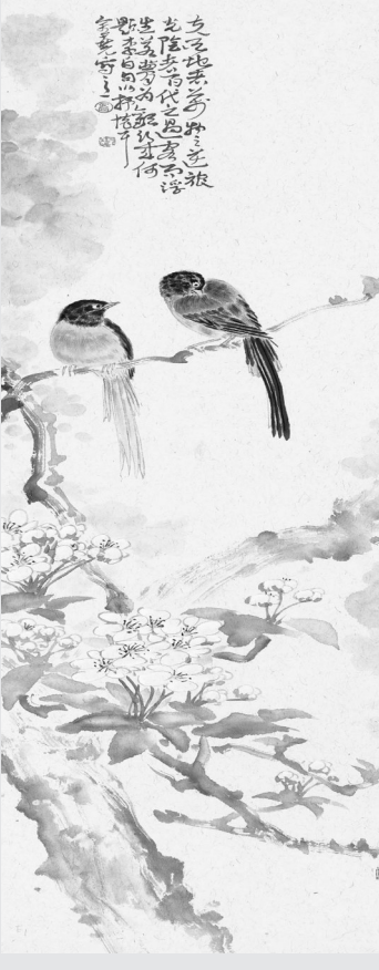
岭树数声春鸟啼(国画) 白金尧