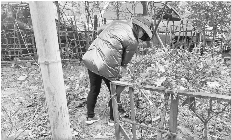
本报讯(记者 刘玉娟 通讯员 谷奕金 文图)为进一步推进爱国卫生运动深入开展,做好社区环境整治工作,昨日,管城区南关街道办事处豫丰社区党群服务中心工作人员联合志愿者开展“疫情防控,卫生要先行”活动。

活动中,社区工作人员及志愿者首先清洁了小区主干道两侧绿化带及卫生死角问题。接着大伙用铁锹铲除石头砖块,用扫帚清扫路面以及清理枯枝落叶,并对乱停乱放车辆进行整理。