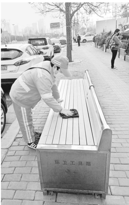
本报讯(记者 梁月琳 通讯员 宋璐 倪永贞 文图)连日来,惠济区以第32个全国爱国卫生月为契机,深入开展“防疫有我,爱卫同行”为主题的爱国卫生月活动,全面推进环境卫生提升综合整治行动。

惠济区城市管理局严格按照“双十标准”,对道路扬尘称重检查实行差别化验收标准。主干道快车道道路每平方米积尘不超过5克,对死角、深沟、施工地点进行深度作业,保持路面无积尘。人工清扫方面坚持一日两扫,全天保洁,清扫保洁质量好,环卫工作期间对重点区域加大清扫保洁力度,遇较多浮土可能扬尘的路段减少清扫幅度,避免扬尘;加强环卫工管理,严禁对路面上的树叶和垃圾进行焚烧。加大对施工工地出入口及附近道路两侧的砂灰、污泥、垃圾等污染路面的清理工作。机械化作业方面,根据现有车辆,吸尘、机扫、洒水车相互配合,实行机械清扫和人工相结合,提高清扫效果,有效抑制扬尘、吸走污物。小型洗扫车每天对部分路段人行道重点洗扫。机械化白天洗扫、吸尘作业,晚上重点推洗道路。主干道机械化作业率达到100%,采取扫、冲结合,吸扫联动形式,针对不同道路采取不同的作业车辆,每天不间断洒水、喷雾作业。确保监测点重点区域无浮土无扬尘。每天对公厕、果皮箱、城市家具等消杀不少于两次。 据了解,昨日,惠济区直机关第三党建联协作党支部将主题党日活动与第32个爱国卫生月有机结合,组织党员开展了爱国卫生月主题党日活动。活动中,大家齐心协力,干劲十足,纷纷拿起铁锹、扫帚、垃圾夹等工具,走进居民小区,对小区绿化带和路面垃圾进行彻底的整治和清理。