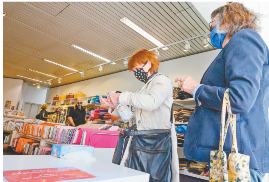
4月20日，一名女子进入德国路德维希堡一家商店时消毒双手。根据德国联邦与各州政府达成的协议，面积不超过800平方米的商铺20日起在满足清洁卫生、人员限流等前提下可恢复开放。

综合新华社驻欧洲地区记者报道，连日来，意大利、法国、德国等欧洲国家新冠疫情持续缓解，但因病患群体庞大，新增确诊、死亡、重症病例数仍然提醒人们不能松懈。目前欧洲多国正在酝酿5月初开始解除部分疫情防控限制，力求在抗疫和恢复经济之间达到平衡。