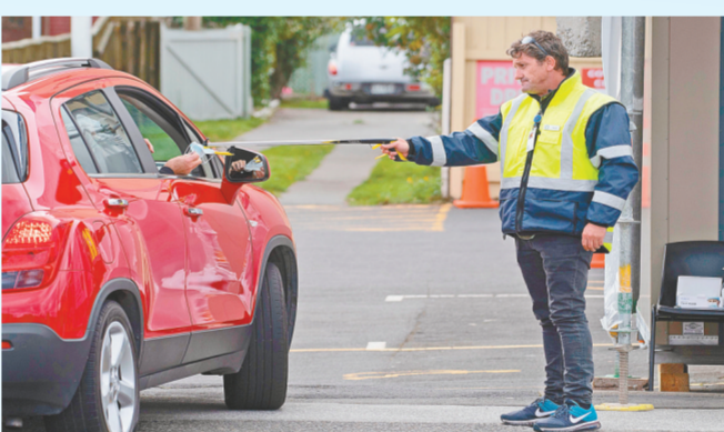
4月20日，在新西兰惠灵顿附近的下哈特，新冠病毒检测站的一名工作人员用长杆递给访客一个口罩。新西兰总理阿德恩当天宣布，新西兰“封城”模式将延长至4月27日23时59分。4月28日起，疫情防控响应等级从最高的四级降至三级并保持两个星期直到5月11日，然后再进行审核。

津巴布韦总统姆南加古瓦19日宣布，为更好防控新冠疫情，将原定19日结束的“封城”措施延长14天，至5月3日。