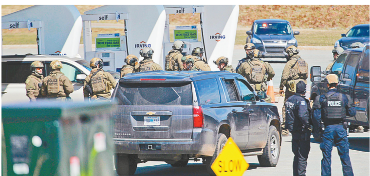
4月19日，在加拿大新斯科舍省，警察在一处加油站准备采取行动。

加拿大警方19日说，一名男子在加拿大新斯科舍省多处地点持枪行凶，枪杀16人后死亡。这是1989年蒙特利尔枪击案以来加拿大最严重枪击案。