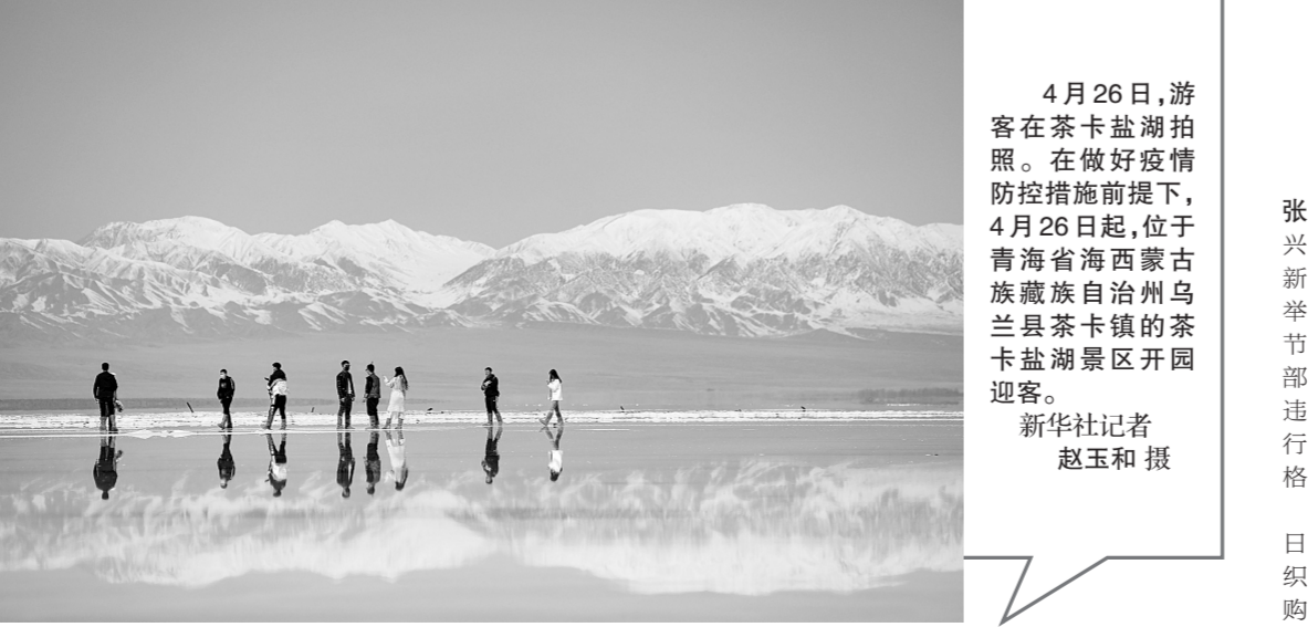
4月26日，游客在茶卡盐湖拍照。在做好疫情防控措施前提下，4月26日起，位于青海省海西蒙古族藏族自治州乌兰县茶卡镇的茶卡盐湖景区开园迎客。

新华社北京4月26日电(记者 高敬)固体废物污染环境防治法修订草案三审稿26日提请十三届全国人大常委会第十七次会议审议。修订草案三审稿切实加强了医疗废物特别是应对重大传染病疫情过程中医疗废物的管理。当前，新冠肺炎疫情阻击战中，及时处理医疗废物是一个重要环节。有的常委会委员、人大代表、部门、地方和社会公众建议，在总结经验的基础上对医疗废物作出更具针对性的规定。修订草案三审稿明确医疗废物按照国家危险废物名录管理。县级以上地方人民政府应当加强医疗废物集中处