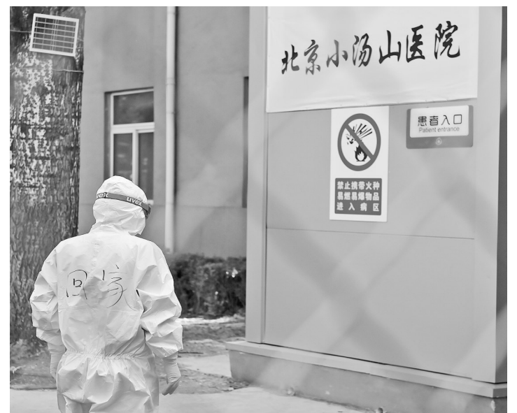
4月28日，一名护送小汤山医院最后一批新冠肺炎治愈患者出院的医护人员的防护服后写着“回家”的字样。

据新华社北京4月28日电(记者 侯克)28日上午8时30分左右，在医护人员的簇拥下，北京小汤山医院最后一批两名新冠肺炎治愈患者手捧鲜花出院。至此，北京小汤山医院新冠肺炎患者全部“清零”，并将于29日关闭备用。