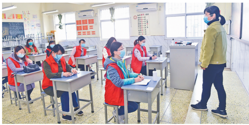
老师们在重新布置的教室里模拟上课