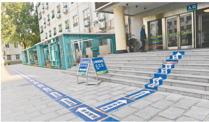
精心的布置,一定能够带来安全

4月29日,郑州市二七区各中小学负责人聚集在郑州四中,集体学习观摩四中返校复学疫情防控实地演练。在高三、初三前期有序返校复学的基础上,郑州四中针对高一、初二复学各项方案进一步细化完善,每个校园环节都明确了时间、地点、责任人和应急措施,覆盖了学生入学、课