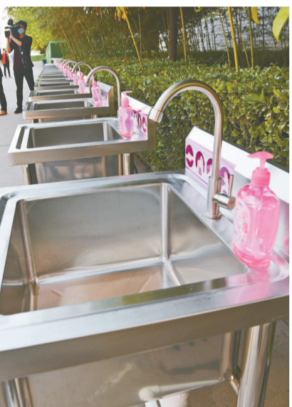
餐厅外安装了新的卫生设备

为确保“五一”期间师生防疫安全,郑州一中向全体老师、学生以及家长送上了一封情意切切的“安全信”提醒。