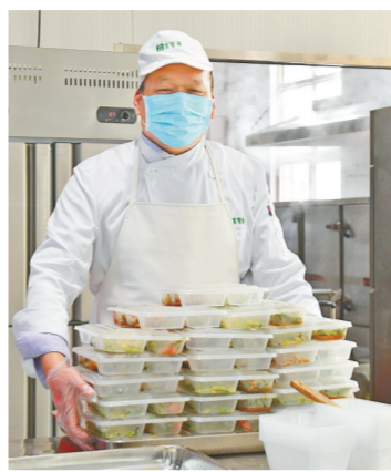
食堂用尽量减少接触的方式提供服务

醒师生:为保持疫情防控成果,共同守护广大师生的生命安全,建议“五一”假期师生不要离开郑州市域。如确需外出,须按照相关要求向学校和所在社区备案登记,返校前必须按要求进行核酸检测,隔离14天。同时,建议大家假期不要到人员密集场所,少出门、少交流,不走亲、不访友,不聚餐、不聚集,不在人员聚集场所逗留,不接触外来人员,有效减少外出活动轨迹,注意个人卫生,最大限度降低自己、家人安全风险。