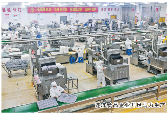
速冻食品企业开足马力生产

为切实保障防疫物资生产供应,我市成立了5个片区防疫物资保供专班和18个重点企业驻厂服务专班,24小时驻厂服务。(下转三版)