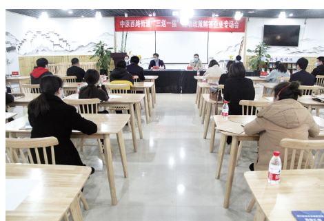
3月17日，中原西路街道在万达广场职工餐厅召开“三送一强”活动政策解答会