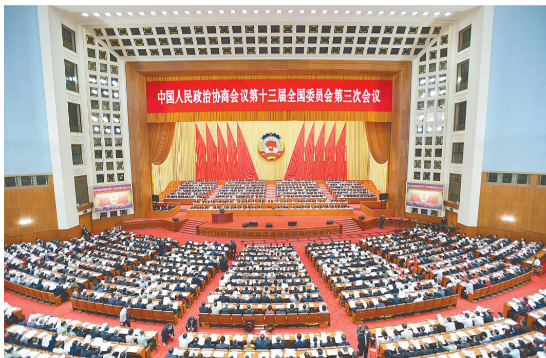
5月21日,中国人民政治协商会议第十三届全国委员会第三次会议在北京人民大会堂开幕。

习近平李克强栗战书王沪宁赵乐际韩正王岐山到会祝贺 汪洋作政协常委会工作报告 张庆黎主持 郑建邦作提案工作情况报告