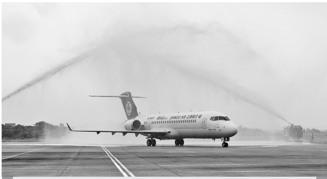
6月10日,“景德镇”号ARJ21客机降落在江西景德镇罗家机场后受到“水门礼”迎接。当日,江西航空引进的第二架国产支线飞机ARJ21在上海浦东机场交付后飞抵景德镇罗家机场,并正式冠名“景德镇”号。