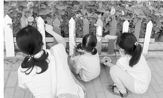
孩子们给社区小花园栅栏涂色

本报(记者 刘伟平 通讯员 程晓晓 文/图)大片的月季、雏菊、向日葵迎风摇曳,绚丽的花儿竞相绽放,社区居民闲庭信步,驻足欣赏……昨日,在二七区大学路街道绿城社区的“袖珍小花园”里,各色鲜花争奇斗艳,芬芳扑鼻,不少居民走出家门,赏花、拉家常。