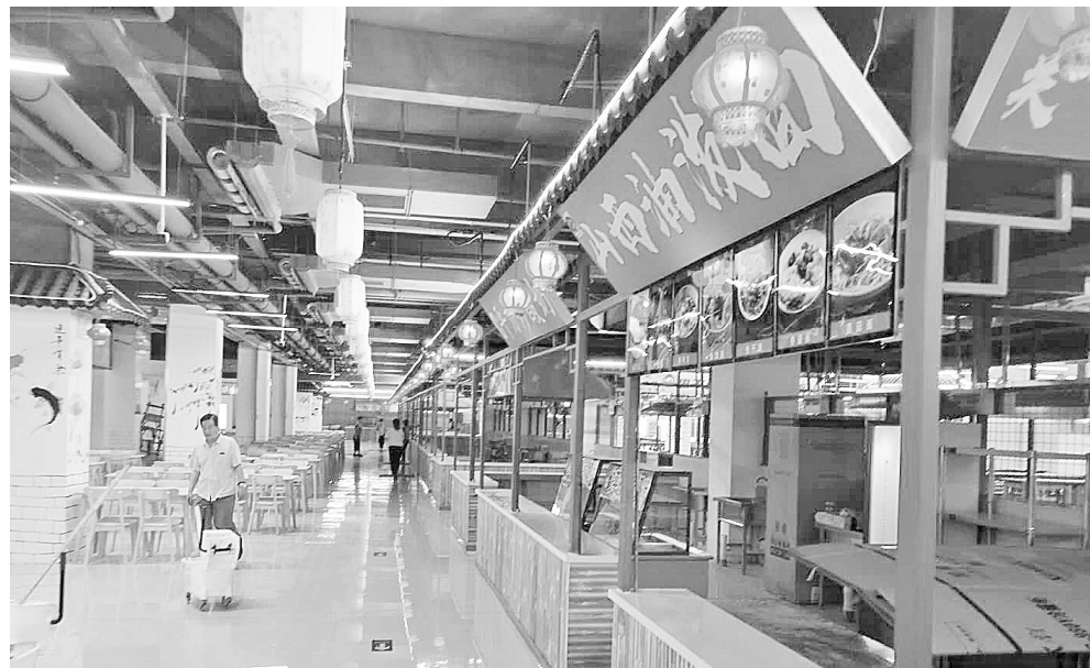
英才美食城已完成内部装修

本报(记者 栾月琳 通讯员 戴刚 文/图)凡近日经过惠济区北大学城英才街附近的市民都会惊喜地发现,这里的市容市貌悄然发生变化,道路干净整洁,交通也比以前顺畅。