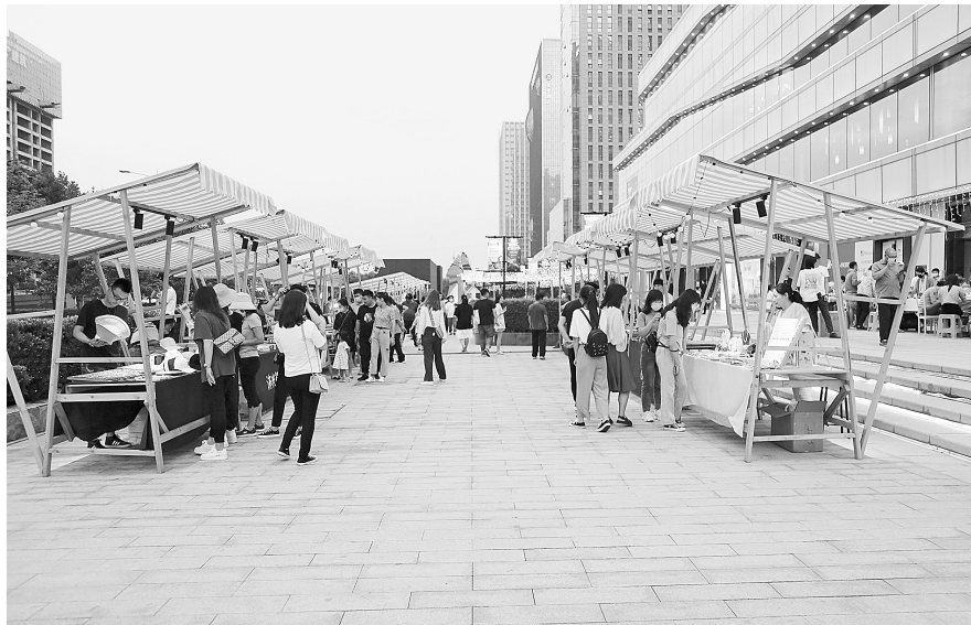
汇艺·银河里夜经济示范街区开张

郑州东站不仅仅是出入郑州的高铁站,更是展示郑州区位优势和中国高铁速度的闪亮名片。作为郑东新区首个开放的夜经济示范街区,毗邻郑州东站乐享城为就业群众提供了50个免费摊位,现场引入乐队献唱、抖音网红达人直播、灯光秀等文化元素、时尚元素,努力构建集饮食、游玩、购物、娱乐、展览、演出等多个业态合一的夜间消费特色街区,让夜经济发展更加有序。距离郑州东站最近的汇艺·银河里在去年成功搭建星光集市的基础上,融合美食餐饮、文创潮流、生活好物、live音乐于一体,升级打造了银河音乐