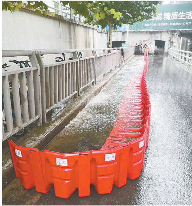
设置挡水板阻水导流,最大限度减少积水对交通的影响

北河口沿河路,陇海路立交(陇海路与陇海铁路立交桥下),南屏路与开发路交叉口,贾岩倒虹吸处,陇海路与京广路交叉口西北角、西南角,西三环全水路西延东南角,博学路与鼎盛路交叉口区域,紫荆山路下穿陇海路涵洞。