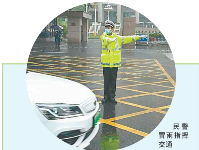
民警冒雨指挥交通