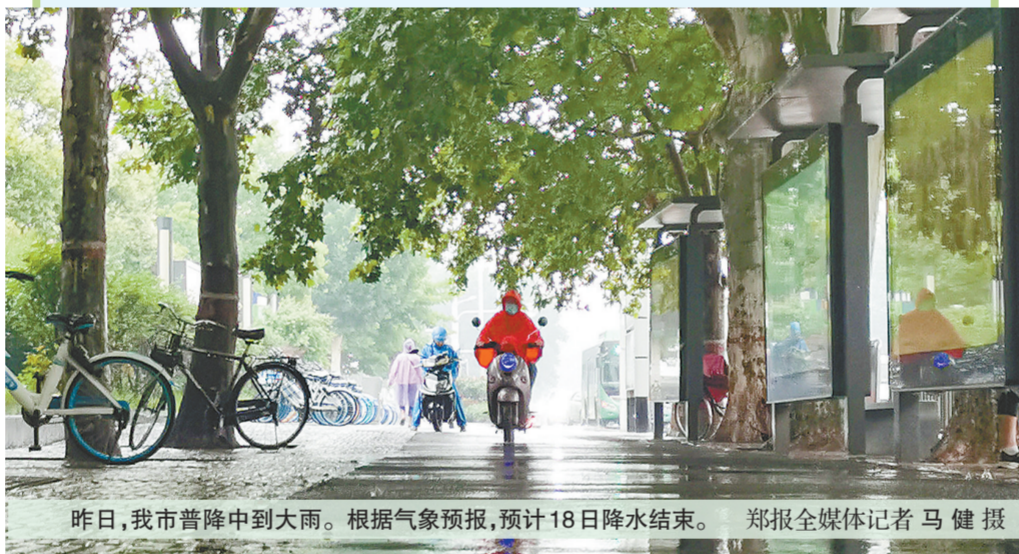
昨日,我市普降中到大雨。根据气象预报,预计18日降水结束。

我市今后7天天气预报情况为:17日(星期三):阴天有中雨,17℃~21℃;18日(星期四):小雨转多云,17℃~27℃;19日(星期五):多云,18℃~29℃;20日(星期六):多云转晴天,20~29℃;21日(星期日):多云,21℃~28℃;22日(星期一):多云转小雨,22℃~27℃;23日(星期二):阴天有小雨,东北风4级,20℃~26℃。