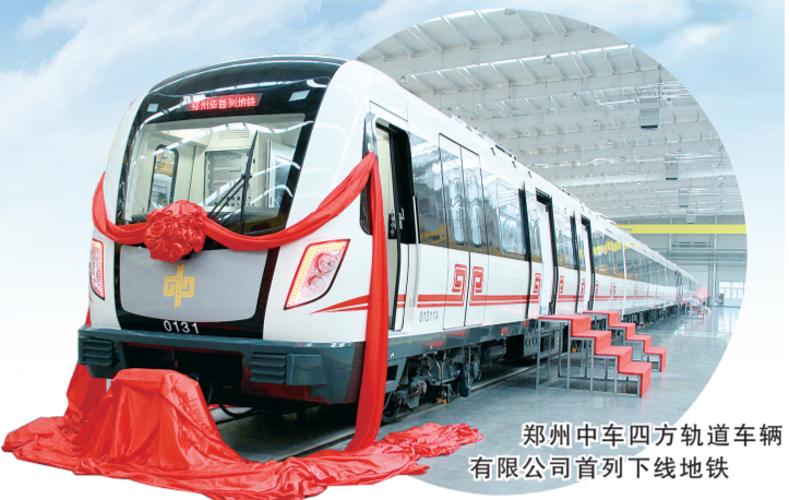
郑州中车四方轨道车辆有限公司首列下线地铁

在难事面前不退缩，在大事面前敢担当。面对汹汹而来的新冠肺炎疫情，荥阳市产业集聚区、豫龙镇统筹抓好疫情防控和经济社会发展，促进经济社会秩序恢复不断加速，为夺取疫情防控和经济社会发展“双胜利”做出了突出的贡献。