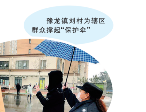
豫龙镇刘村为辖区群众撑起“保护伞”

守住一条底线，营造高质量发展环境。全力做好安全生产、信访稳定、疫情防控。全面开展“安全创建”和专家隐患排查活动，加大问题整改，确保不发生重特大安全事故。牢牢底线思维，控制信访增量，减少存量，加大矛盾排查力度，开展积案集中化解，力争把问题消灭在萌芽状态。严格落实各项防疫措施，加快常态化防控队伍建设，狠抓宣传引导不放松，科学精准做好环境消杀，持续加强重点场所和特殊人群管控，抓紧抓实抓细常态化疫情防控工作。