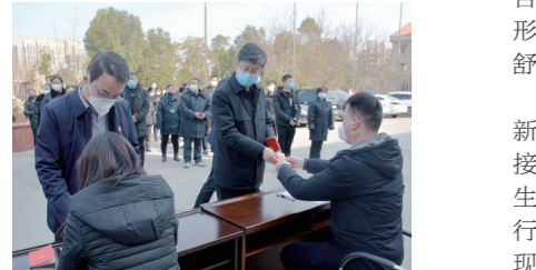
“特殊党费”践初心 助力防疫阻击战