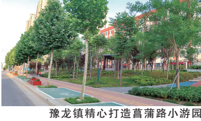
豫龙镇精心打造蒲蒲路小游园