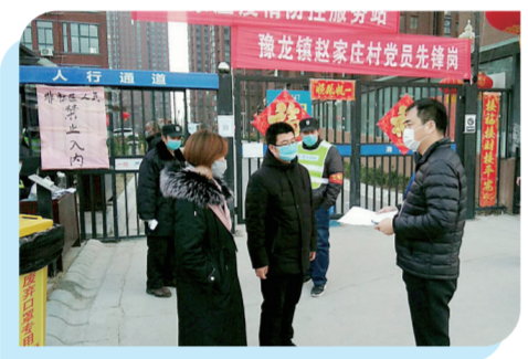
▲豫龙镇赵家庄村防疫党员先锋队