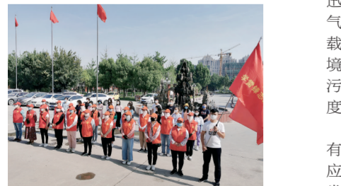
豫龙镇机关党支部开展“志愿服务 助力创文”主题党日活动

以党的高质量建设为引领，2019年，荥阳市产业集聚区、豫龙镇团结带领广大党员干部群众，埋头苦干，开拓创新，各项工作保持了齐头并进、勇走前列的良好态势，实现了经济稳步增长和社会事业协调发展，先后被授予郑州市平安建设工作优秀乡镇、郑州市信访工作“四无”乡镇、郑州市安置房回迁工作先进集体、郑州市新型城镇化先进集体、国家卫生城镇等多项荣誉，连续获得荥阳市乡镇综合考核优秀第一名。