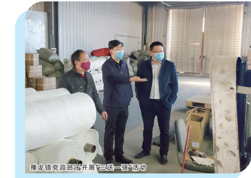
豫龙镇党政班子开展“三送一强”活动

豫龙镇处于郑州市中原区、高新区和荥阳市主城区之间，紧邻郑州市主城区，近年来，随着郑州新型城镇化深入推进，周边征迁群众及外来人口大量涌入，城乡接合部村庄人口规模迅速膨胀，形成新的“城中村”，水、电、气、暖、道路及污水管网等基础设施承载力明显不足，停车难，行车难，环境脏乱差，治安混乱，甚至暗藏“散乱污”企业和黑作坊，城乡接合部治理难度不断加大。 为了破解城乡接合部治理瓶颈、有效缓解新型城镇化带来的“连锁反应”，荥阳市产业集聚区、豫龙镇坚持党建引领，全力以赴推动“三项工程、一项管理”高效落实，坚持做好“加、减、乘、除”四篇文章，高效推进城乡接合部综合改造，促进城乡功能、品质、形象全面提升，全力打造“整洁、有序、舒适、愉悦”的城乡环境。 党委强化“加砝码”，城乡提品焕新颜。豫龙镇党委深刻认识到，城乡接合部综合改造是贯彻落实黄河流域生态保护和高质量发展国家战略、践行以人民为中心的发展理念的重要体现，是检验“不忘初心、牢记使命”主题教育成果的生动实践。城乡接合部综合改造工程提出以后，第一时间制定