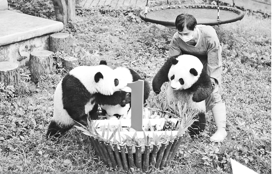
6月23日，饲养员怀抱大熊猫来到生日会现场。当日，重庆动物园为4只大熊猫“双双”“重重”“喜喜”“庆庆”举行周岁生日庆祝活动。4只大熊猫在重庆动物园熊猫馆运动场内玩耍嬉戏，享用市民游客为它们亲手制作的“生日蛋糕”。2019年6月23日，大熊猫“兰香”产下了双胞胎兄弟“双双”“重重”，大熊猫“莽仔”产下双胞胎姐妹“喜喜”“庆庆”。