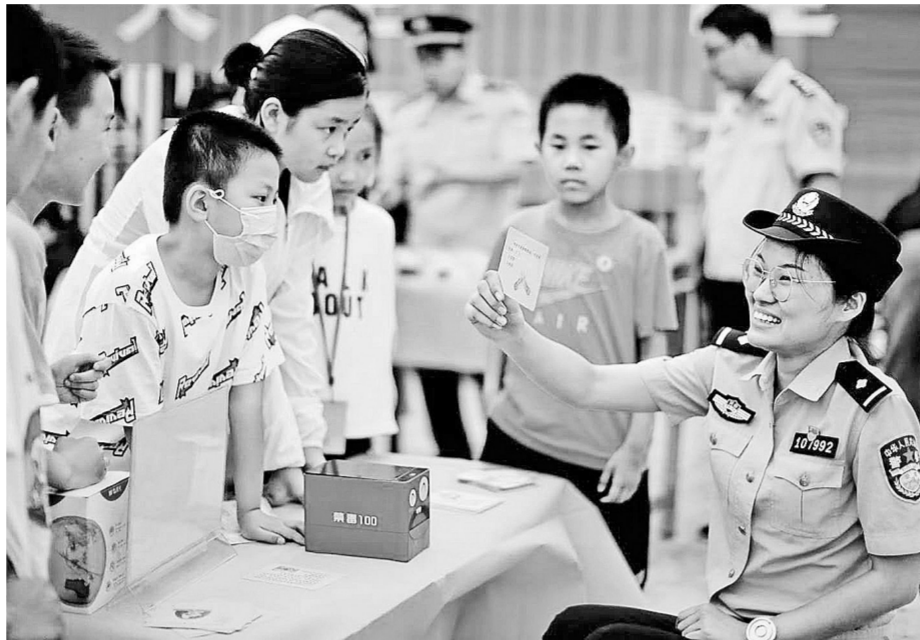
今天是国际禁毒日,连日来,郑州警方开展了多项禁毒宣传活动,营造全社会共同禁毒的浓厚氛围。图为新郑警方在街头广场开展禁毒宣传。

上的烙画、形色各异的面塑,让人目不暇接,大家跃跃欲试,纷纷上前请教。郑州文化馆负责人告诉记者,让社区居民学习非物质文化遗产工艺品制作技艺,既深入了解传统节日及文化习俗,又增加了空闲时间的经济收入,使得传统非遗文化与市场接轨,形成了以文化带动经济、以经济保护文化的完美闭环。下一步,郑州文化馆、郑州市非物质文化遗产保护中心将长期开展非遗工艺品制作技艺培训,让乡亲们充分掌握制作技术,实现精准扶贫脱贫。