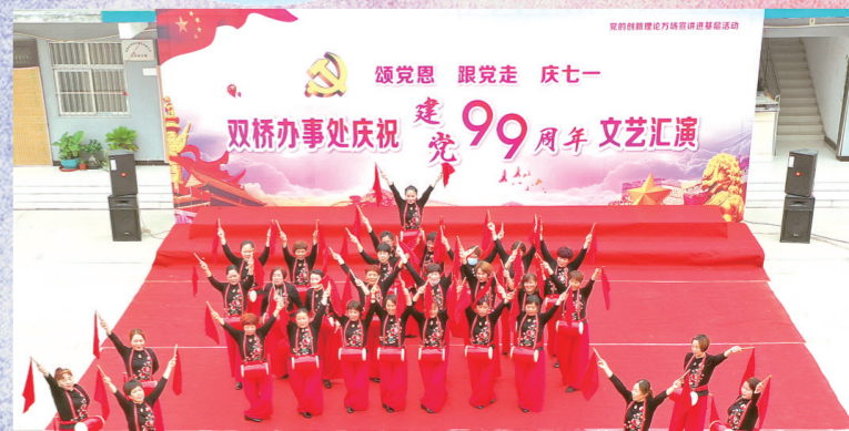
6月30日上午，双桥办事处开展庆祝建党99周年暨党的创新理论万场宣讲进基层文艺汇演活动。