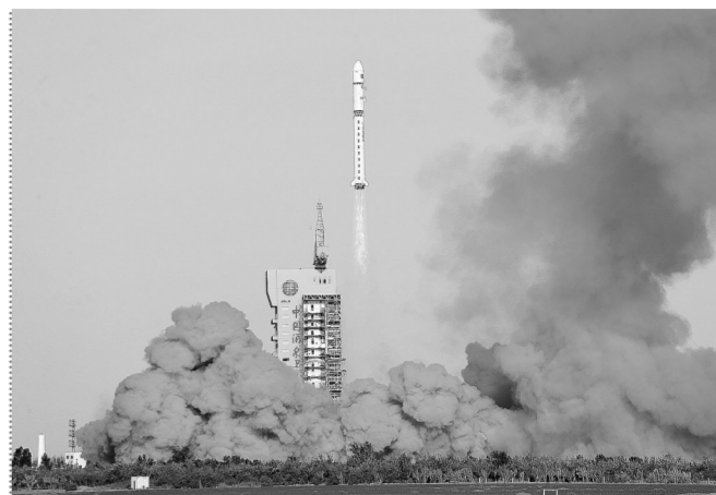
新华社酒泉7月5日电 5日7时44分,我国在酒泉卫星发射中心用长征二号丁运载火箭,成功将试验六号02星送入预定轨道,发射获得圆满成功。试验六号02星主要用于开展空间环境探测及相关技术试验。这次任务是长征系列运载火箭的第338次飞行。