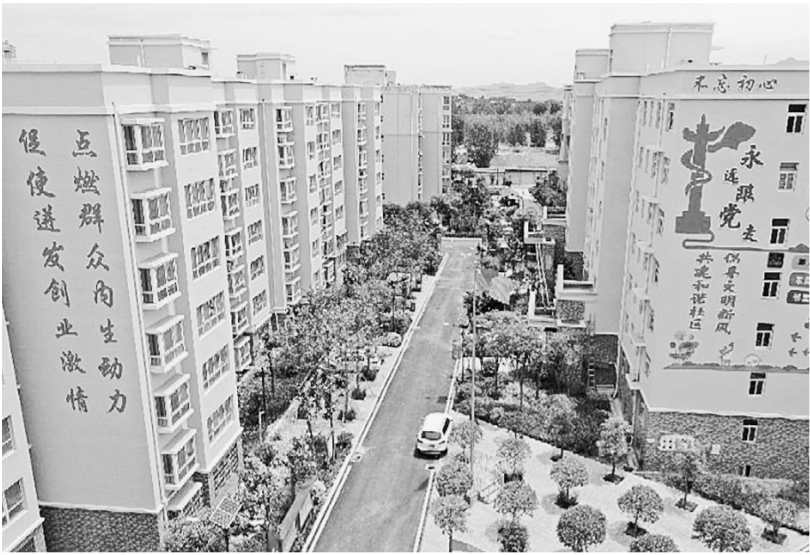
易地扶贫搬迁点高楼林立,环境优美

本报(记者 李晓光 通讯员 卢松娥 文图)“以前,我们村里没有工厂或企业,想要赚钱就得外出打工,这样一来就顾不了家。如今,家门口就有服装厂,赚钱顾家两不误。”提起搬迁带来的好处,家住登封市君召乡雨露社区的马玉琴赞不绝口。