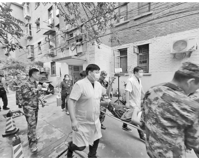
近日,管城区陇海马路街道党工委组织开展汛期危房群众转移安置应急演练,提高应急处理能力,为汛期安全提供保障。