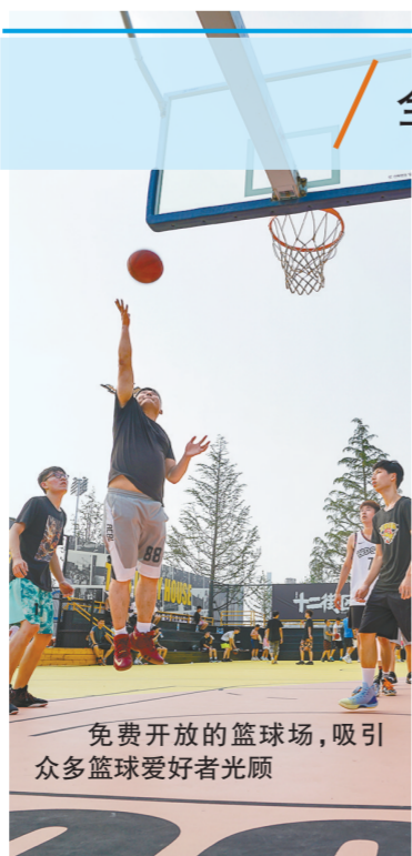
免费开放的篮球场，吸引了众多篮球爱好者光顾

8月8日，是我国的第12个“全民健身日”，郑州市奥体中心当天举行了丰富多彩的线上线下全民健身展演及体验活动。展演过后，更多群众自发地参与到健身活动中来，真正诠释了“全民健身”的主题。(详见二版)