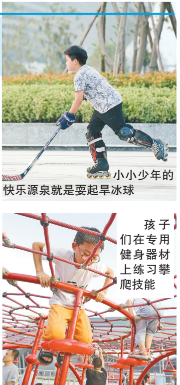
小小少年的快乐源泉就是要起旱冰球