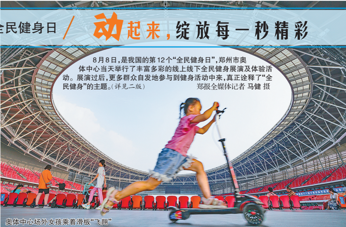
奥体中心场外女孩乘着滑板“飞翔”