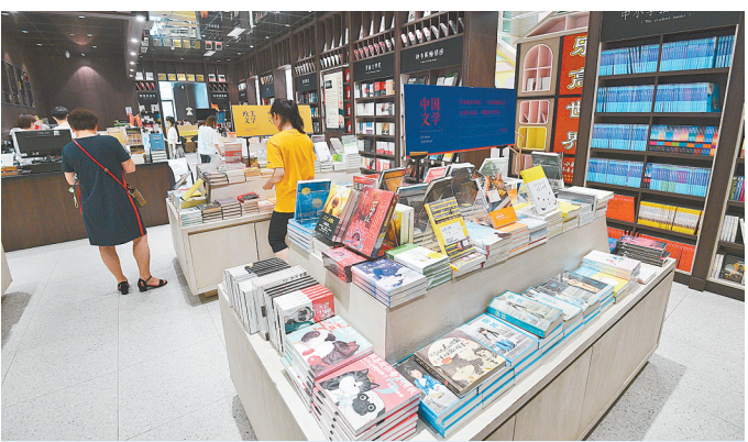
书店成了不少市民的好去处