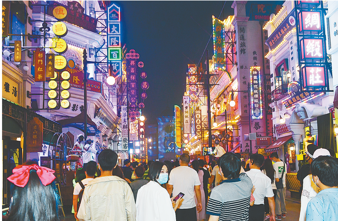
游客在建业电影小镇欢乐度假

炎热天气下，既凉爽又能健身的运动，非游泳莫属了。而且夏季正值暑期，扎堆儿学游泳的孩子，更助推了这项运动的火爆。这几天，市内各大游泳场馆