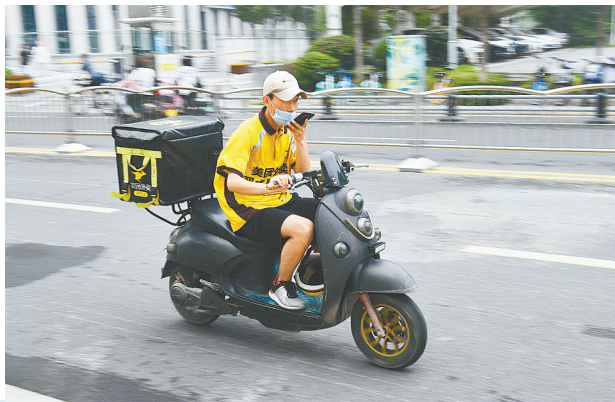
高温天，外卖小哥格外忙