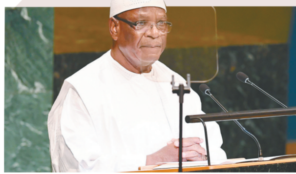
这是2018年9月24日在位于纽约的联合国总部拍摄的马里总统凯塔的资料照片

全国人救赎委员会还邀请民间团体和社会政治运动力量加入他们,为实现“可信的选举”创造条件。