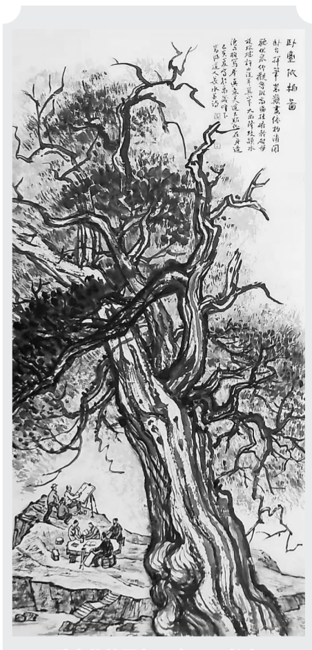
鹊桥依树图(国画) 王长水

相传,七夕那天晚上,青年男女,藏在葡萄架下,仿佛隐约可以听到牛郎织女无尽思念的呢喃情语。尽管这个古老习俗有些荒诞,甚至是悲剧结束,奇怪的是,每年到了这一天,青年男女依然愿意自觉地去固守那个虚无缥缈的传说,以期得到心中积存已久的某种期盼和希冀。过去如此,现在更是如此。