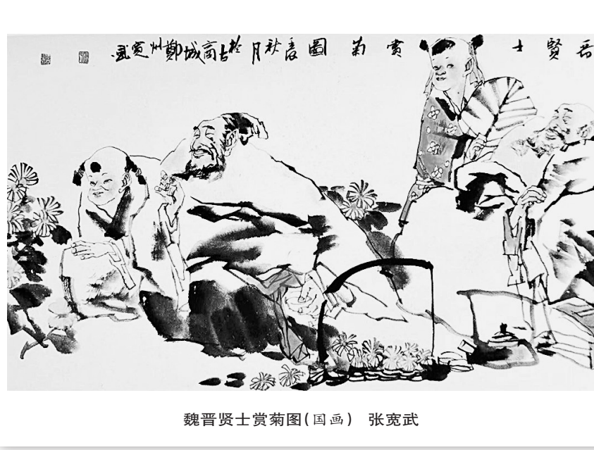
魏晋贤士赏菊图(国画) 张宽武

《邓稼先》是2017年春季新人教版语文七年级下册教材第一课课文,作者是杨振宁。科学家写科学家,文章成为中学教材,这恐怕也是绝无仅有的。杨振宁和邓稼先曾是北京崇德中学和西南联大的同学,后先后赴美留学。杨振宁比邓稼先大两岁,一直像兄长一样照顾着邓稼先。1971年夏,杨振宁回国访问,想见的朋友第一人便是邓稼先,而当时邓正在西北办“学习班”,周总理派人费尽周折才找到了他。后来邓稼先的妻子许鹿希教授说,这次相见,实际上起到了保护邓稼先的作用,也等于帮助和保护了“两弹”事业。邓稼先病重住院后,杨振宁曾先后两次回国探望,还从美国想办法搞到了当时尚未上市的治疗癌症的新药。1987年10月23日,邓稼先逝世一年后,杨振宁回国为其扫墓,夫人许鹿希遵照邓稼先遗嘱,将一套光洁如墨玉的故乡安徽的文房四宝赠予兄弟杨振宁,以纪念两人长达半个世纪的友谊。