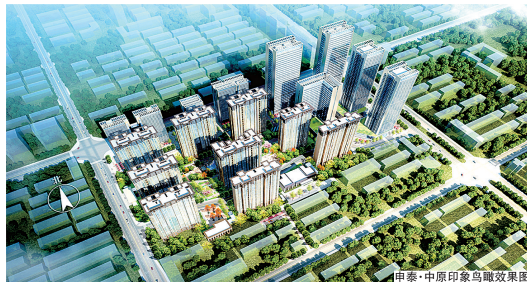
申泰·中原印象鸟瞰效果图

来自欧洲的全球高端儿童游乐设施企业康攀KOMPAN以高安全性、高品质、高设计品位居称全球,康攀KOMPAN采用可食用级环保材质,被