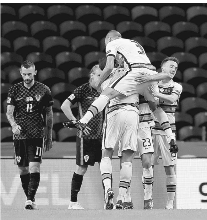
葡萄牙队球员菲利克斯(右二)在进球后和队友庆祝